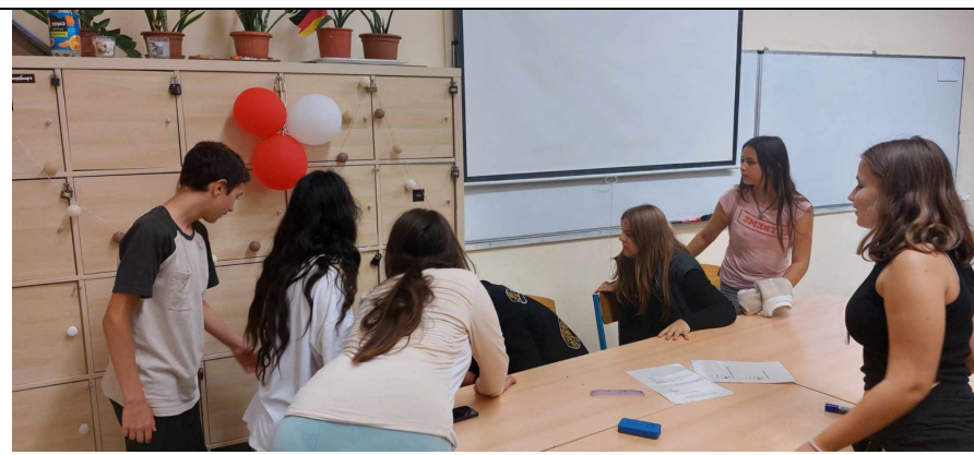
Keress a megoldást!