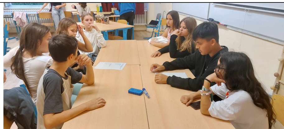
Szabadulószoza - Team