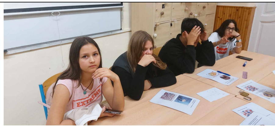
Anyám, hová kerültem?