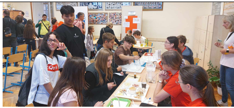
Amit eszel, azzá leszel... Laboratóriumi vizsgálódások az élelmiszerekkel