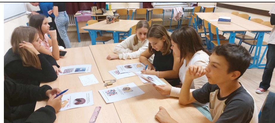
Csikorognak a fogaskerekek, dolgoznak a neuronok